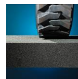
Résistant à la compression