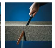
Facile à découper