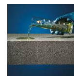
Résistant aux acides